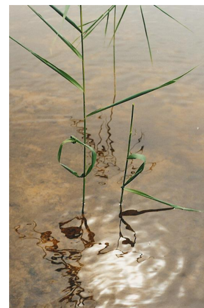
Piège à éclipse « OR » roseau littoral aquitain 1999