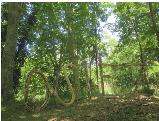
OSIEZ installation végétale en osier blanc. Réservoir d'écluse de Calonges 9mx3m 2014