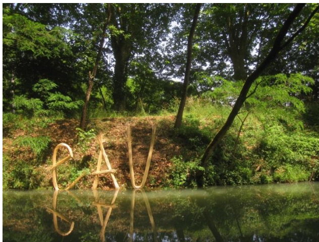
EAU installation végétale en osier blanc. Réservoir d'écluse de Calonges 5mx3m 2014