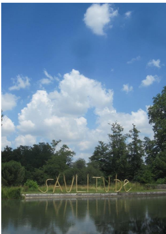
SAULITUDE osier, vime et saule 3mX16m écluse du pont canal de Montpouillan