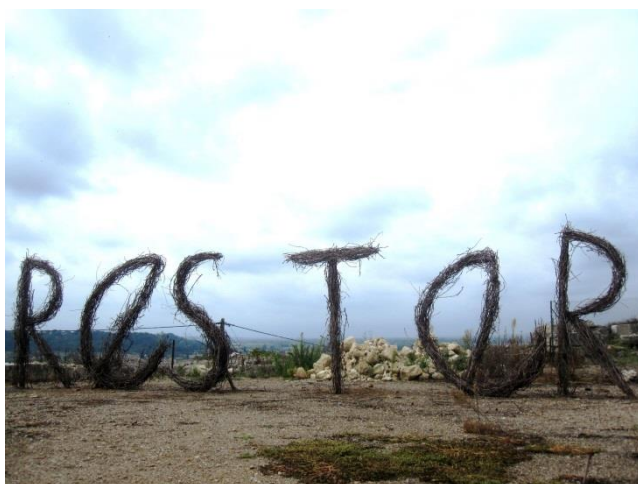
RES TER sarments & vîmes 2m50mX16m esplanade du Château

Dominique Etna Corbal ArTiste ArTpenteur.