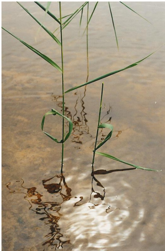
Piège à éclipse « OR » roseau littoral aquitain 1999