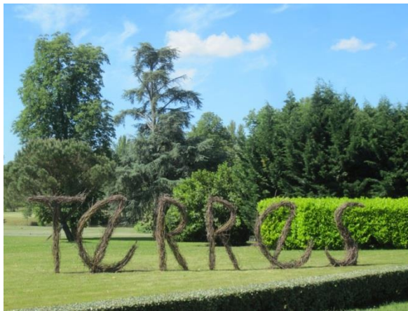
TERRES sarments & vîmes 3mX16m jardins du Château