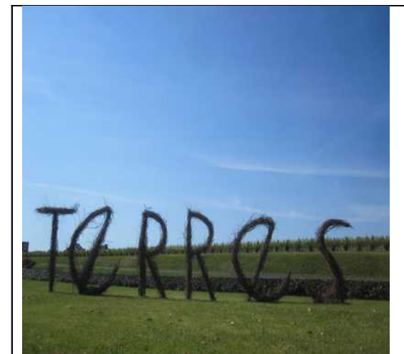
installation végétale « TERRES » sarments & vîmes 3m x 16m Château LARRIVET HAUT BRION 2013 Etna CORBAL