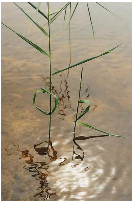
Pièce à éclipse « OR » roseau littoral aquitain 1999