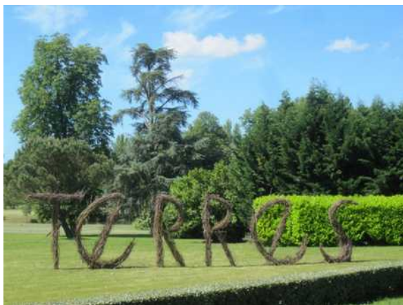
TERRES sarments & vîmes 3mX16m jardins du Château