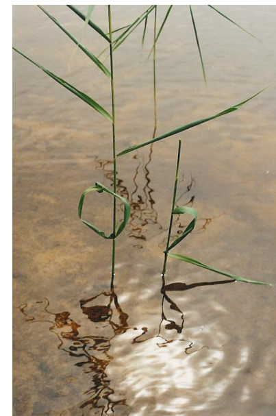
Piège à éclipse « OR » roseau littoral aquitain 1999