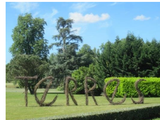
TERRES sarments & vimes 3mX16m jardins du Château Larrivet Haut Brion 2013