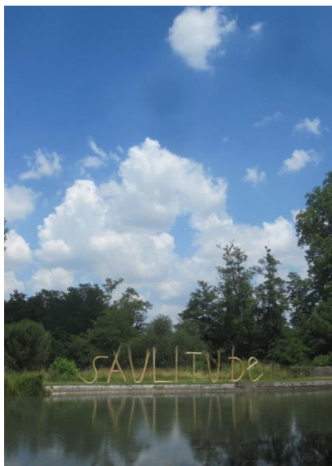
SAULITUDE osier, vime et saule 3mX16m écluse du pont canal de Montpouillan installation végétale en osier blanc Canal de GARONNE 2014

L'eau comme source des fluides du vivant, de la sève à la salive, du végétal à l'humain...du minéral à la lumière. La Terre et l'Or comme matériaux d'origine et de destinée des transformations possibles.